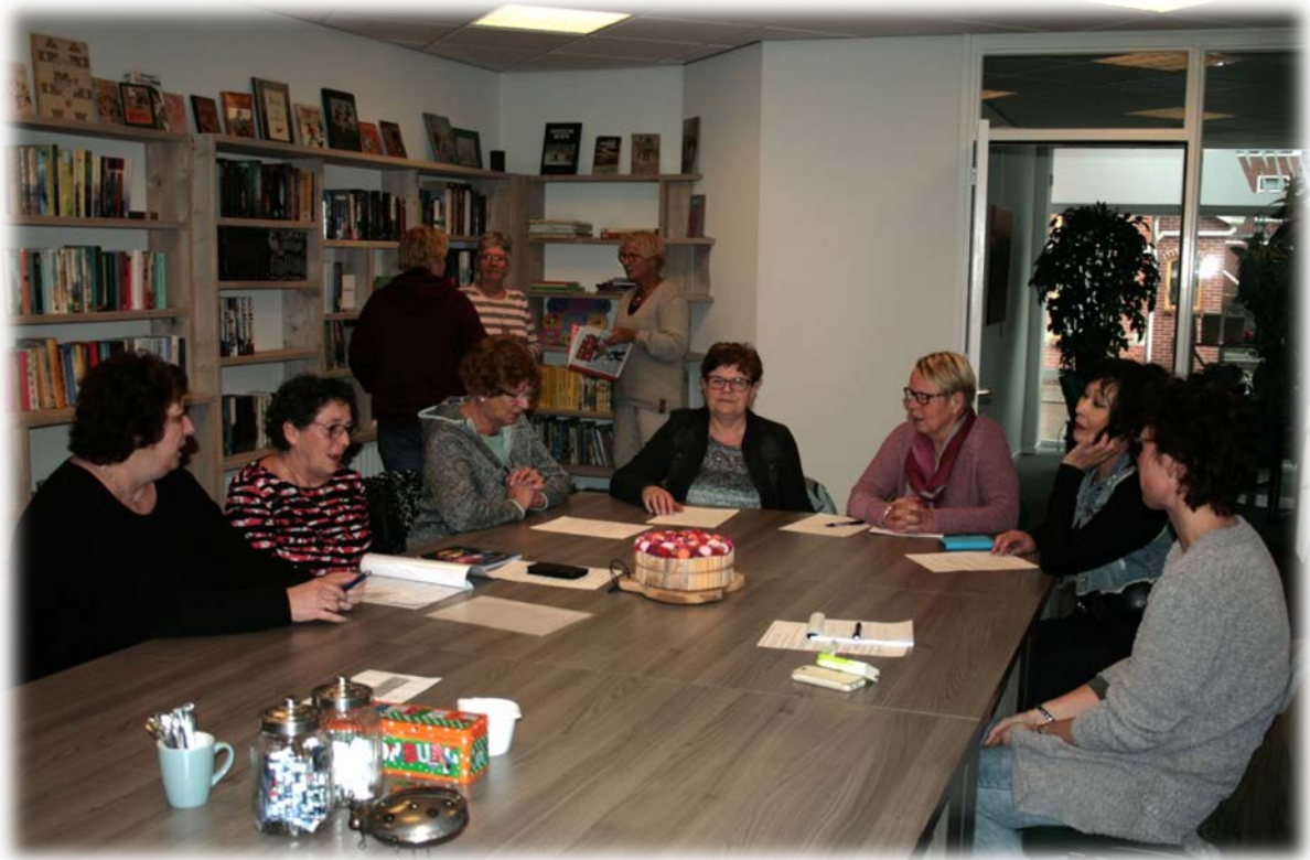
Steunhörn: "De Boekenkuis"